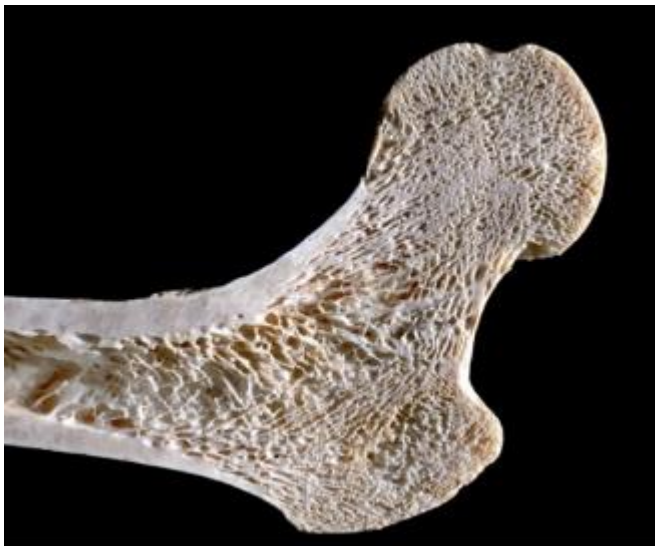
Abbildung 1: Schnitt durch einen Knochen

Die Natur macht es uns vor: sie gradiert Bestandteile der Körper von Lebewesen. Beispielsweise besitzen Zähne eine harte Oberfläche und einen weicheren Kern - wäre der Kern ebenfalls hart und spröde, würden häufig Zahnteile absplittern. Knochen hingegen haben an unterschiedlichen Stellen verschiedene Porositätsgrade, um gleichzeitig stabil und möglichst leicht zu sein.